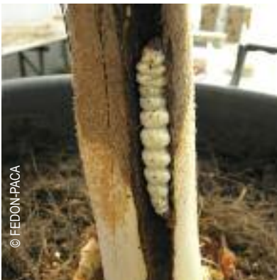
Larve du papillon palmivore

La chenille est le stade ravageur qui vit à l'intérieur du palmier en creusant des galeries.