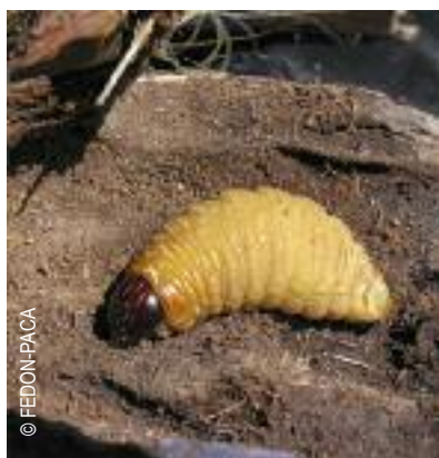
Larve du charençon rouge du palmier

Détecté en 2006 cet insecte ravageur s'est répandu dans tout le sud de la France. Il pose un double problème : toute plante colonisée est condamnée à terme et elle constitue un environnement très