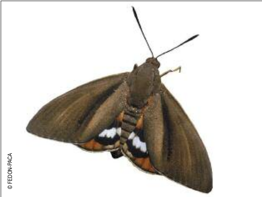
Papillon palmivore adulte

La chenille est le stade ravageur qui vit à l'intérieur du palmier en creusant des galeries.