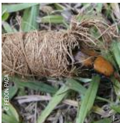
Cocon du charençon rouge du palmier

propice à sa reproduction. L'insecte étant extrêmement prolifique, une femelle pond 200 à 300 oeufs. La colonie se développe à l'intérieur du palmier et se nourrit de ses tissus, provoquant sa mort.