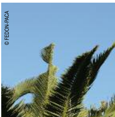
Dégâts sur les palmes