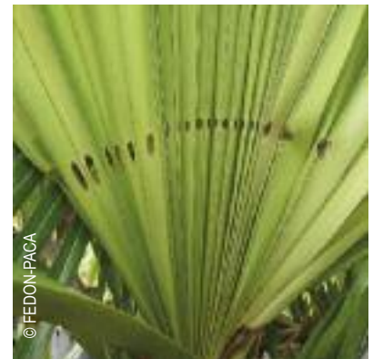
Dégâts du papillon sur les palmes

Au service du ministère de l'agriculture en charge de la protection des végétaux sur le département (SRAL) et à la mairie de votre commune de résidence qui transmettra elle-même le signalement.