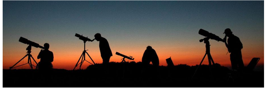
Table thématique : « Chasseurs d'étoiles, cartes du ciel... »

Fermeture de la médiathèque du lundi 5 août au lundi 26 Aout 2019 inclus