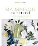
Ma maison au naturel / Aroma Zone