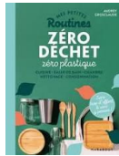
Zéro déchet, zéro plastique / A. Grosclaude