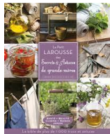
Le Petit Larousse des secrets et astuces des grands-mères