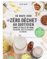
En route vers le zéro déchet au quotidien...