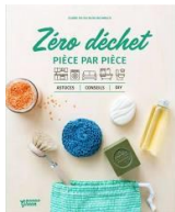
Zéro déchet pièce par pièce / C. Do