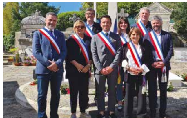
Cérémonie du 81 e anniversaire de la Victoire du 8 mai 1945