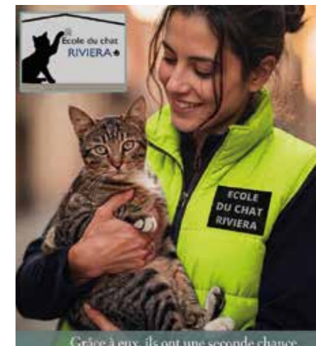
Grâce à eux, ils ont une seconde chance.

"Parce qu'une ville agréable se mesure aussi au bien-être de ses animaux !"